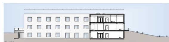
(Ansicht Dependance Solingen)