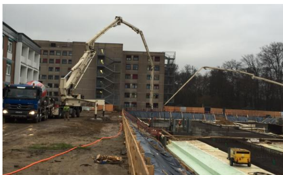
(Baustelleneinrichtung Haus 60 Gießen der Bodenplatte)