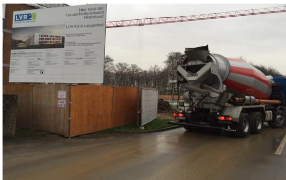
(Baustelleneinrichtung Haus 60 Gießen der Bodenplatte)

Am 26.01.2016 sowie am 09.02.2016 wurde die Bodenplatte für Haus 60 gegossen. Das Gießen der Bodenplatte erfolgte mit einer Anzahl von ca. 200 Betonmischfahrzeugen, die bereits in den frühen Morgenstunden bis zum Abend im Einsatz waren. Aktuell sind die Rohbauarbeiten für Haus 60 im vollen Gange. In Kürze erfolgen die nächsten Gießarbeiten zur Erstellung des Erdgeschosses.