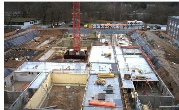
(Baustelleneinrichtung Haus 60 Stand 02.03.2016)