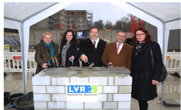
(Grundsteinlegung Haus 60)

Am 22.02.2016 wurde der Grundstein für Haus 60 gelegt. Für die Grundsteinlegung wurde eine Zeitkapsel mit Plänen des Haus 60, einer aktuellen Tageszeitung, Münzen und einer Urkunde gefüllt und im Mauerwerk verbaut.