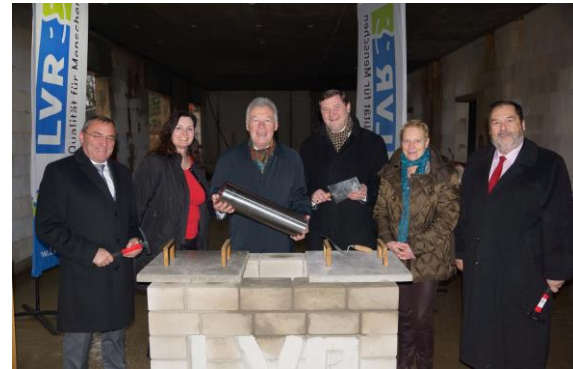
(Grundsteinlegung Dependance Solingen; 11.01.2017)

Am 11.01.2017 fand die Grundsteinlegung für die Dependance Solingen statt. Durch den zügigen Bauverlauf wird das Richtfest und somit der Abschluss der Rohbauarbeiten bereits am 07.03.2017 stattfinden.