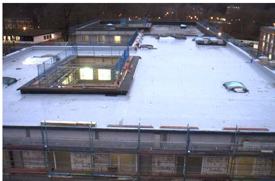
(Baustelle Haus 60; Stand 11.01.2017)